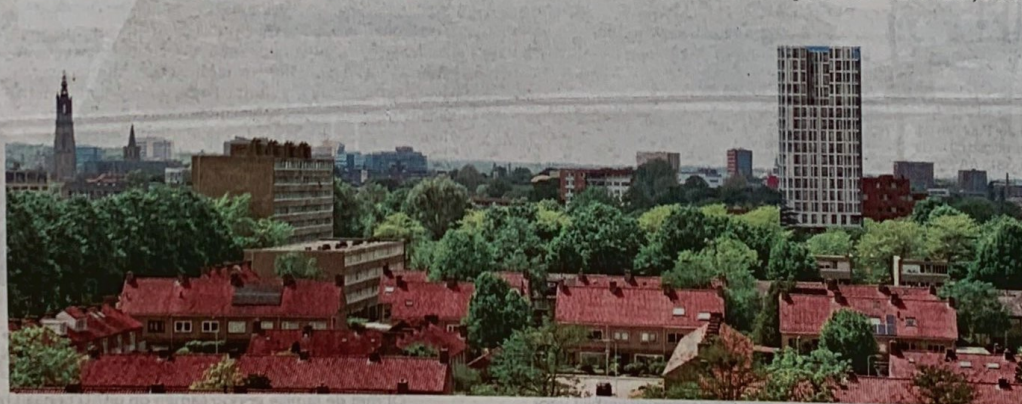
◀ Een fotomontage die bewoners maakten van de toekomstige woontorens in hun wijk deed in een eerder stadium de wenkbrauwen fronsen bij de ontwikkelaar.

kritiek. 'Er is helemaal niets gemanipuleerd. Deze artist's impression is net als alle andere beelden in de ruimtelijke onderbouwing gemaakt met een uiterst nauwkeurig computerprogramma. De gebouwen zijn van alle kanten getekend en in perspectief gezet. Vanaf de Zangvogelweg gezien is dit straks het beeld', aldus Van Loon.